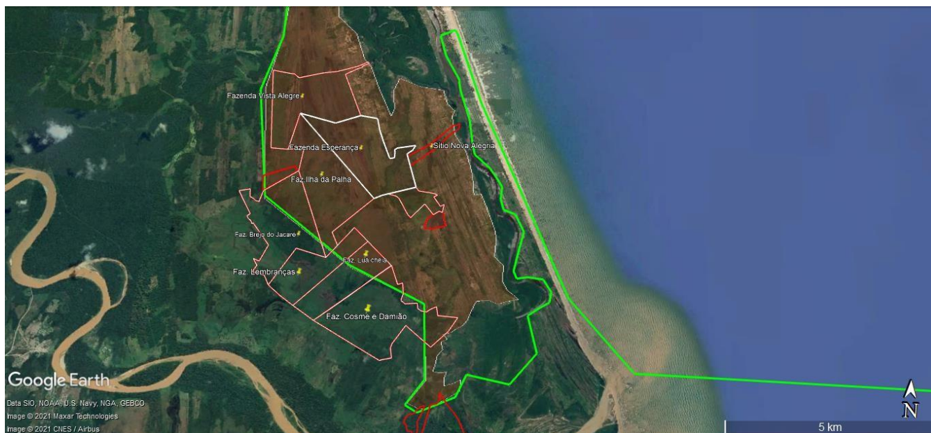
Figura 03: mapa de parte da RESEX de Canaveiras com destaque para área sem CCDRU e com áreas que possuem CAR/CEFIR registrados no site do INEMA-BA.

Consiste em levantar e analisar a documentação imobiliária, necessária à instrução processual com base na Instrução Normativa ICMBio nº 04/2020, correspondente aos imóveis (posses, usos ou domínios) das áreas mostradas na imagem. Trata-se de fazendas identificadas na região fora do CCDRU de acordo com o sistema CAR/CEFIR do Estado da Bahia. Mais detalhes dos imóveis (nomes dos proprietários, nomes dos imóveis e demais informações que o ICMBio possuir) serão repassados aos consultores após contratação.